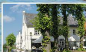
Café Brasserie 't Vaerhoes