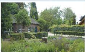
Botanische tuin Jochumhof