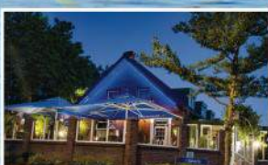
Quatre Bras: Poort van Steyl