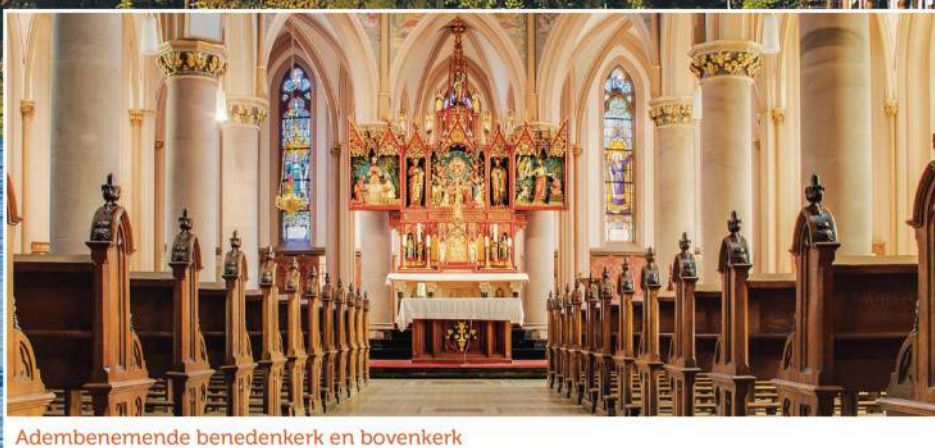
Adembenemende benedenkerk en bovenkerk