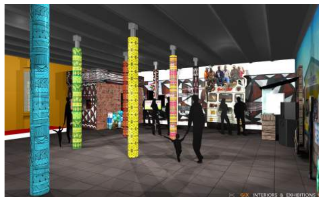
Illustraties: GIX Interiors & Exhibitions/Horst